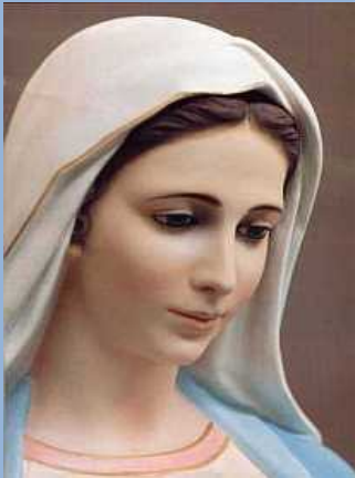
Maryja Krolowa pokoju