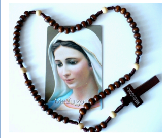
z różańcem w rękę