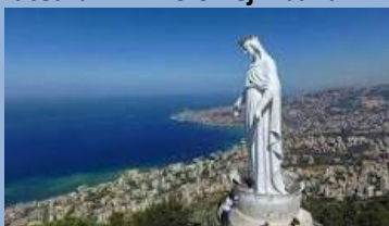
Katedra MB Królowej Libanu