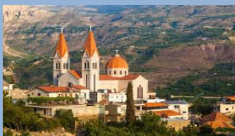
Ortodoksyjna Katedra sw Pawla