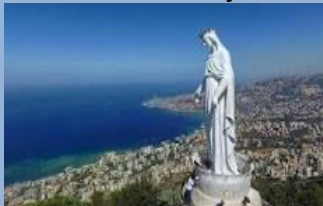
Katedra MB Królowej Libanu